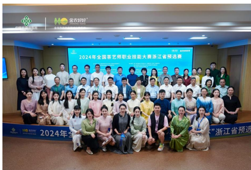
图5 校企联合承办浙江省茶艺师比赛

今年，校企双方共同承接了全国供销总社行业技能大赛浙江省茶艺师、评茶师、调饮师、茶叶加工工选拔赛的赛项技术方案制定及实施，积极开发设计赛项，推广茶技能赛事。在行业起到赛事引领作用，打造了职业技能竞赛品牌，同时助力企业开展文化交流活动，全方位展示了校企合作成效。