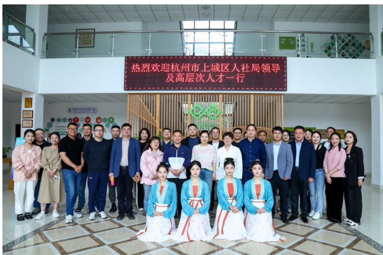
图 6 协助企业开展科技人才文化交流活动