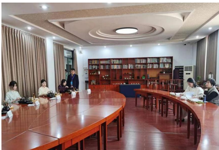
图3 开展中级茶艺师技能考证