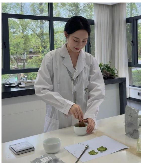
图4 优秀毕业生入职浙茶集团开展抹茶产品研发